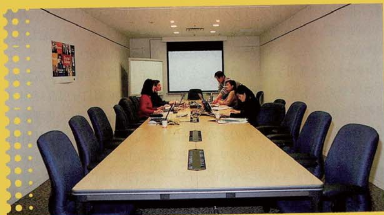
▲一般の執務空間と全く同じ条件で、ノートパソコンなども利用できる会議室。

オフィスに定席を作らない、“フリーアドレス制”を採用する会社が少しずつ増えている。そんななか、赤坂に本社を持つシスコシステムズ(株)は、単なるフリーアドレス制導入にとどまらず、人や場所、そして時間にさえとらわれないビジネス空間を作り上げた。そのキーポイントは、IT技術の駆使と、より快適で効率的なオフィスを追求する姿勢にある。