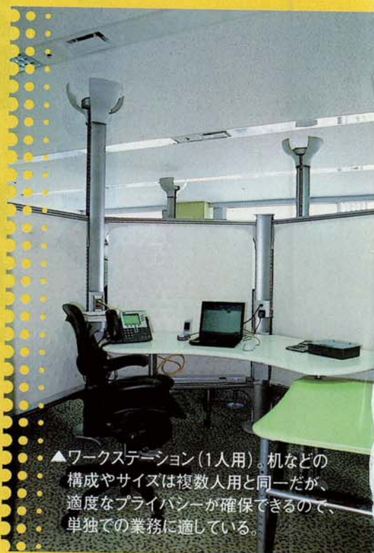
▲ワークステーション(1人用)。机などの構成やサイズは複数人用と同一だが、適度なプライバシーが確保できるので、単独での業務に適している。

インターネットを活用することで情報を全社で共有する環境を構築することが、同社のフリーアドレス制の基本であり、そのサポートに用いられているのは自社製品だ。オフィスのあらゆる場所に無線LANを設置したことで、従来は回線敷設が困難だった場所でも、同じ情報が共有できるようになっている。机の上の電話はすべて「IP PHONE」。社員は個人の電話番号を所有しており、社内IPネットワークのどこに接続しても同じ番号で電話や留守番電話が利用できる。このように、ひとつのIPネットワークに音声(電話)、データ、そして映像も統合した効率的な社内ネットワークインフラを構築。また、社外や自宅からのセキュリティが完備されたネットワークアクセスも準備したため、組織の生産性向上に大きく寄与している。