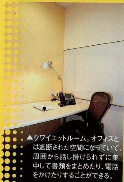
▲クワイエットルーム。オフィスとは遮断された空間になっていて、周囲から話し掛けられずに集中して書類をまとめたり、電話をかけたりすることができる。