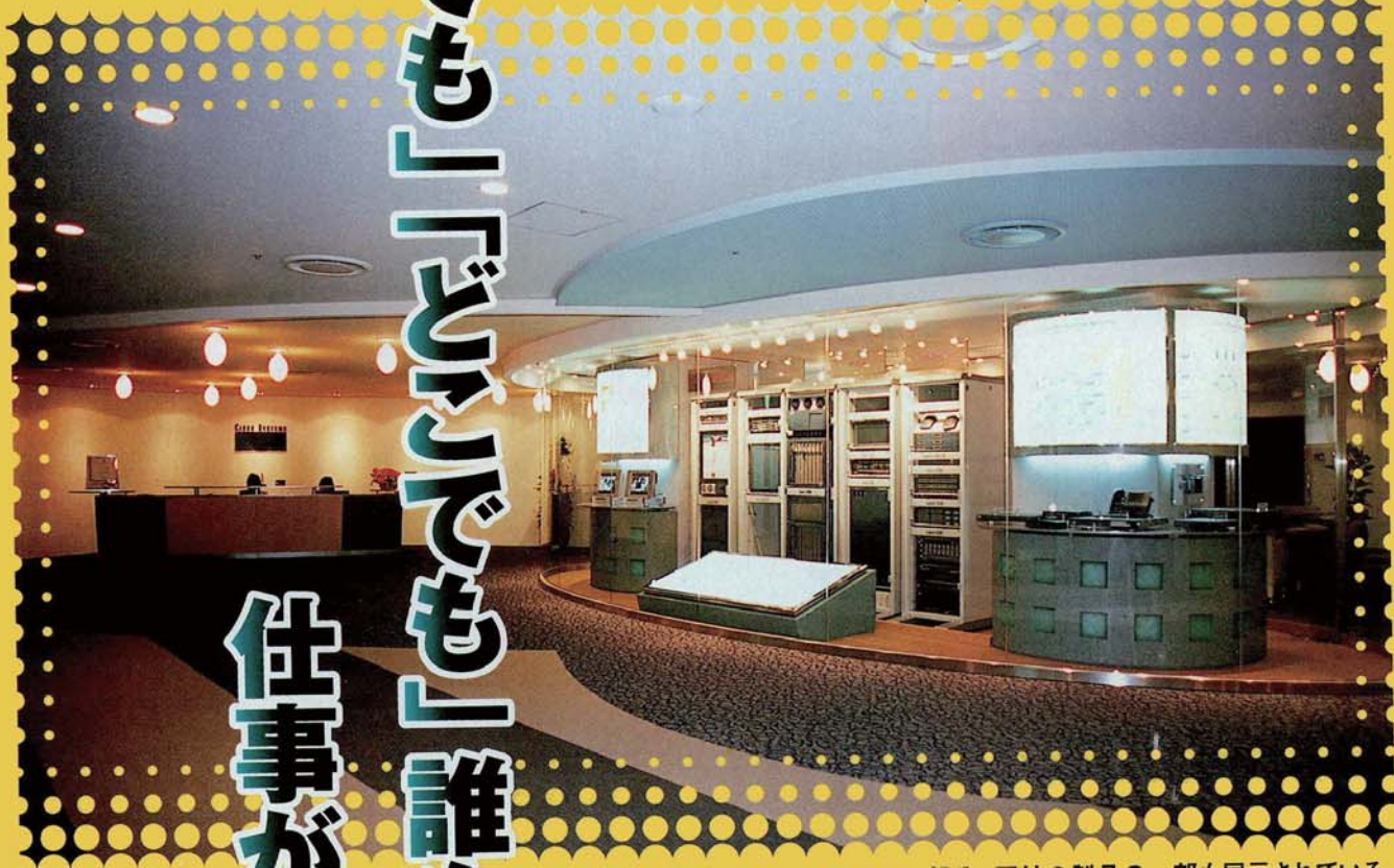
▲エントランス部分。同社の製品のの一部も展示されている。

オフィスに定席を作らない、“フリーアドレス制”を採用する会社が少しずつ増えている。そんななか、赤坂に本社を持つシスコシステムズ(株)は、単なるフリーアドレス制導入にとどまらず、人や場所、そして時間にさえとらわれないビジネス空間を作り上げた。そのキーポイントは、IT技術の駆使と、より快適で効率的なオフィスを追求する姿勢にある。