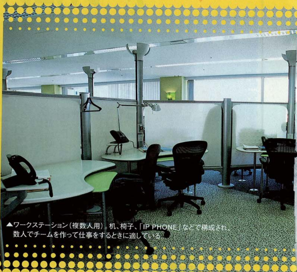
▲ワークステーション(複数人用)。机、椅子、「IP PHONE」などで構成され、数人でチームを作って仕事をするときに適している。