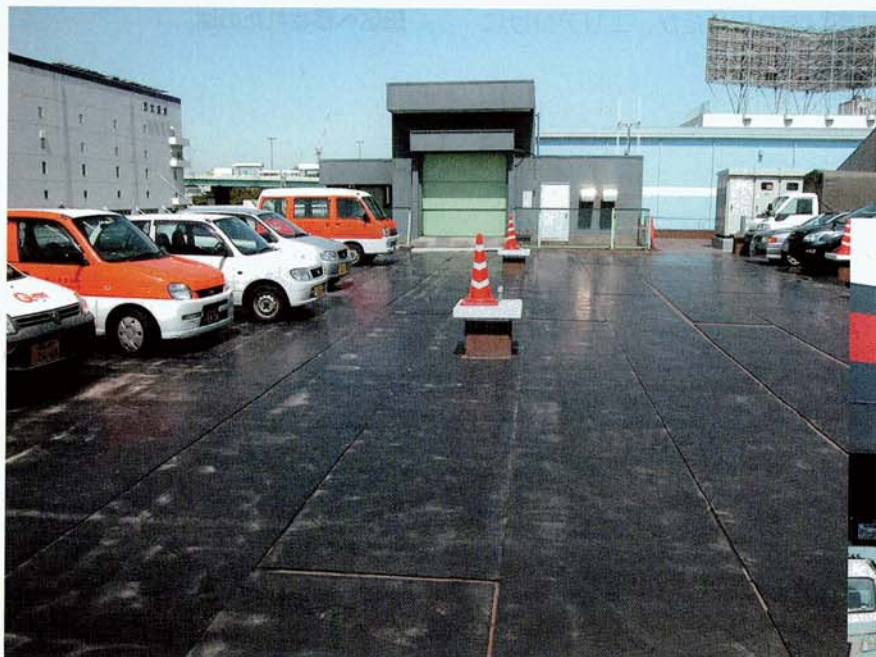
辰巳サポートセンターの屋上は駐車場になっており、車両の昇降をスムーズに行えるよう専用のリフトが備えられている。