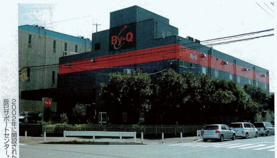
2002年に開設された 辰巳サポートセンター。