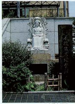
日本橋魚河岸の碑