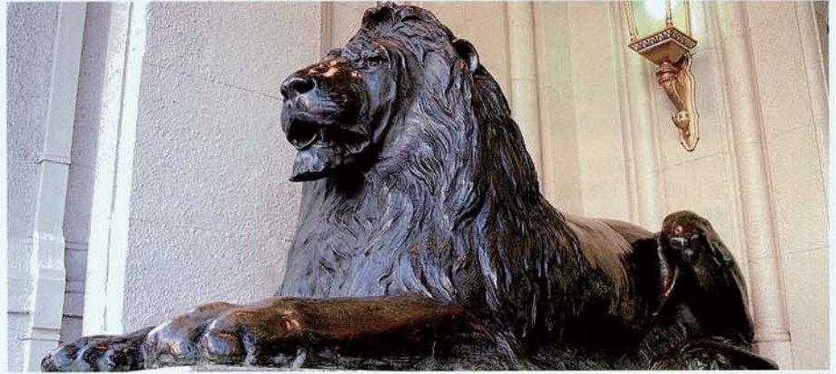
三越本店のライオン像

ライオン像。「誰にも見られずに背中 中にまたがると、願いが叶う」とい う噂さえある彼らは、この街を代表 する待ち合わせ場所として、365日、 獅子奮迅のはたらきをしていると か。