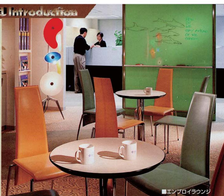
■エンプロイラウンジ