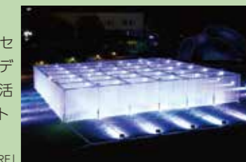
※2016年「CURTAIN WALL THEATRE」

“デザインを五感で楽しむ”をコンセプトに、生活の中の様々なものをデザインとして捉え、豊かな日常生活を提案するデザインの総合イベント