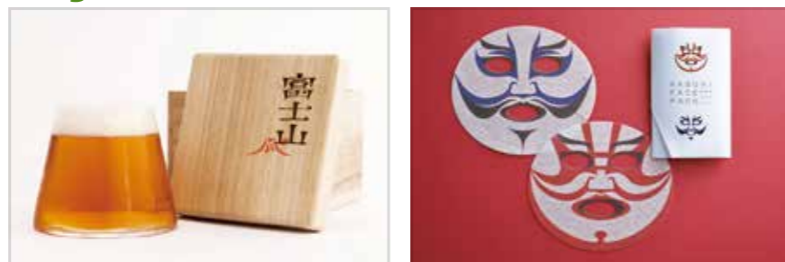
デザインコンペ受賞後、商品化された「富士山グラス」と「歌舞伎フェイスパック」

明日を担うアーティストやデザイナーの発掘と支援を目的とした「Tokyo Midtown Award」。アートコンペでは受賞者に制作補助金と展示スペースを提供し、作品発表のチャンスを実現します。またデザインコンペでは、自由な発想によるデザインを募り、受賞後は東京ミッドタウンが商品化支援も行います。2008年の開催以来、商品化14点、イベント化1点の実績があります。東京ミッドタウンでは、デザイン&アートの側面から社会に貢献するため、「Tokyo Midtown Award」を通じて、未来の才能をサポートしていきます。