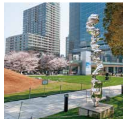
「ファナティックス」トニー・クラッグ作