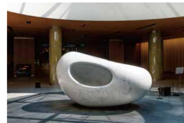
東京ミッドタウンを訪れる人々を出迎えるメインアート、イタリア在住の彫刻家・安田侃による彫刻作品「意心帰」(左)と「妙夢」(右)。

東京ミッドタウンのアートプロジェクトは、計画の当初からアートディレクターやアーティストをはじめ全ての関係者の緊密なコラボレーションによって進められました。その結果、アートが建築と一体化し、さらに街や庭園の機能とも調和した環境が実現しました。街全体を様々な文化が会う庭園に見立て、訪れる人々の心を癒し、感性に語りかけます。