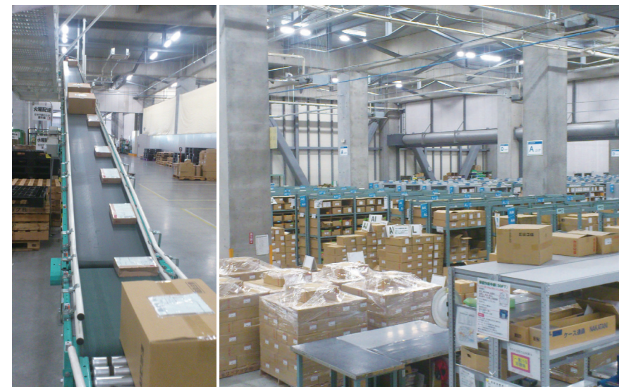
▲厚木物流センター内部

する多数の企業とのネットワークと、安定した長期運営ができるというファクターが、当社物流施設投資の進展の礎になっていこうと考えています。今回は大阪での借地方式による開発ですが、積極的な情報収集を続け、今後は首都圏でも同様の開発型の案件も含め、物流施設投資を実施していきたいと考えています。しかし、ただ数多く広げるのではなく、慎重に選び抜いた案件に集中して取り組みたいと思っています。長期安定運用方針のオーナーが保有する物流施設に入居したいというテナントのニーズは今後増えると思っていますし、また、CRE戦略についても、ますます注目度が高まるなかで、土地に関し物流適地ではあるが手放したくない、所有したまま活用したいというニーズや、既存施設の潜在的なオフバランスニーズもあるでしょう。そのようなニーズに応えられるよう、これからも物流施設投資事業を推進していきたいと考えています。」