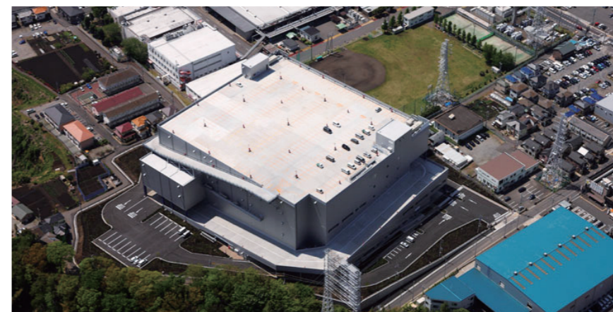
▲厚木物流センター（上空より）

外資系企業の日本進出に端を発する物流不動産投資では、不動産事業に歴史ある日本生命とは言え後発であることは確かなこと。しかし同社には、オフィスビル事業の実績と日本全国に拠点を持つ卓越したネットワークという2つの武器がある。また、自社で大型ビルを開発、建設する専門部隊を擁しており、近年、スペックが標準化されつつある大型物流施設についても自社で開発が可能とのことだ。これまでオフィスビル事業で培ってきた、安心安全な施設環境の提供、幅広い企業に使ってもらえる汎用性、そして何よりも長期保有が前提なので、テナント企業が安心感を持って施設に入居できるといった特性は物流施設でも同じであり、多様化する物流業界においても、これが同社の競争優位性につながっていくという判断が、参入の大きなポイント