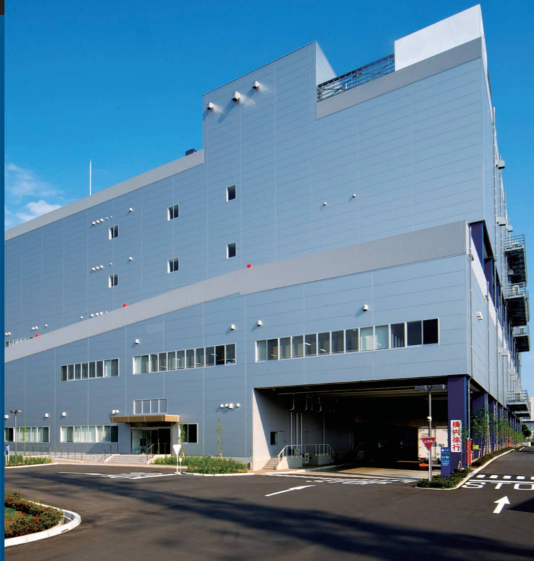
▲日本生命が大規模物流施設投資第1号案件として、2014年4月に取得した「厚木物流センター」

日本生命が大型物流施設の単独開発を実施。新規成長領域への投資を本格化させた同社が、物流施設をターゲットに掲げた戦略とその背景。