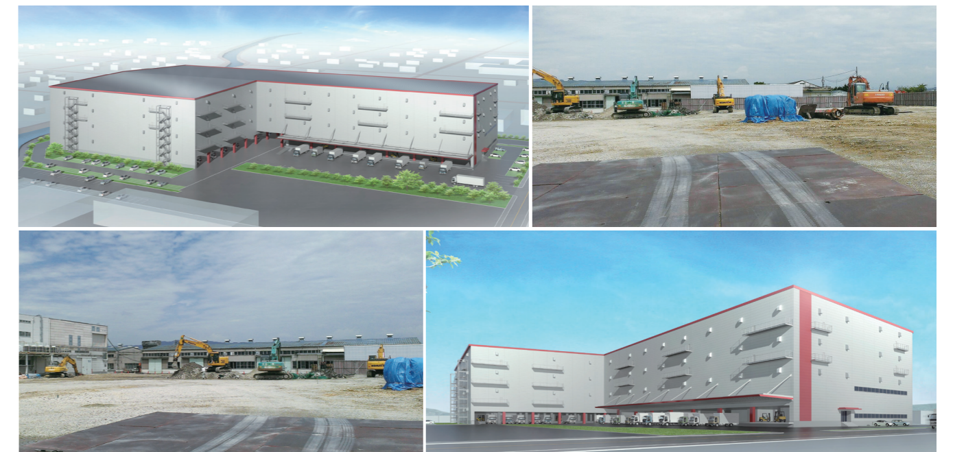
▲初の単独開発を発表した大阪・松原の大型物流施設の完成予想図(イメージ)と開発準備工事中の敷地