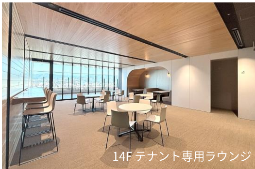
14F テナント専用ラウンジ