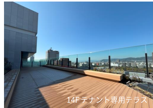
14F テナント専用テラス