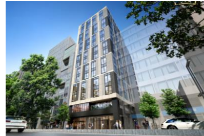
THE VILLAGE SAPPORO

札幌のオフィスマーケットは今、大きな転換期を迎えています。新築ビルの最新動向と、札幌初進出となるWeWorkの拠点開設を通じて、次世代の働き方を探ります。WeWorkによる札幌市・ナシオとのパネルディスカッションも実施予定。拠点戦略の一助にお役立てください。